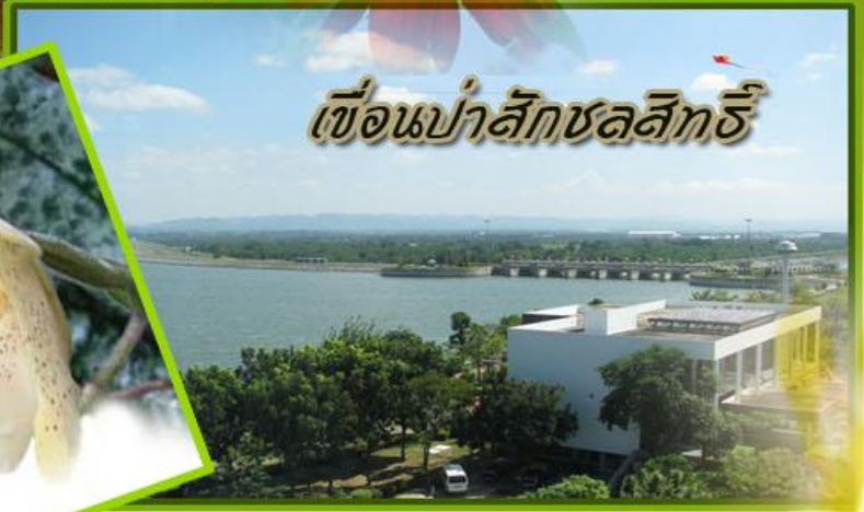
เขื่อนป่าสักชลสิทธิ์